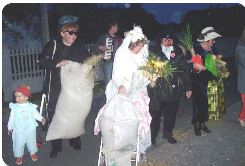
Polterabend w Spóroku