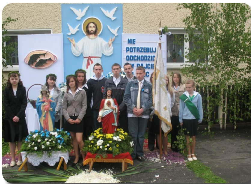
Ółtarz i służba liturgiczna podczas Bożego Ciała